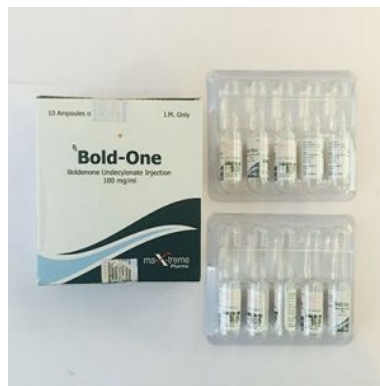
High Quality Bold-One in USA