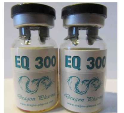
High Quality EQ 300 in USA