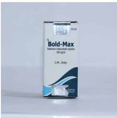
High Quality Bold-Max in USA