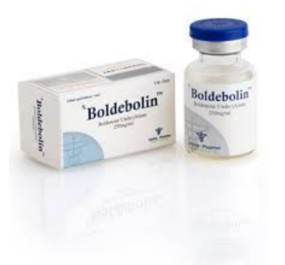
High Quality Boldebolin (vial) in USA